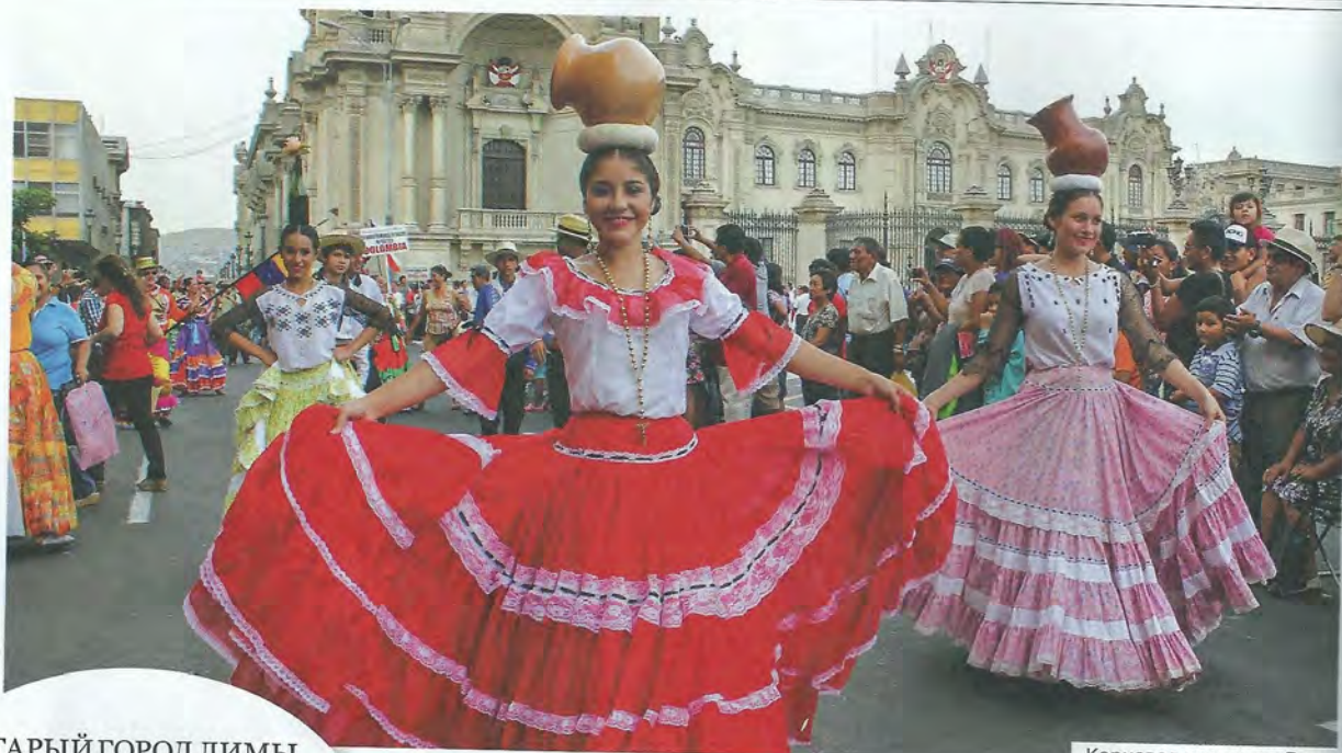
Карнавал на улицах Лимы

Вырос в Риге, проходил службу в Севастополе, закончил училище во Львове. Сейчас живет в Москве и работает ведущим на радио «Серебряный дождь», телеканалах «Дождь», «Культура» и «Моя планета».